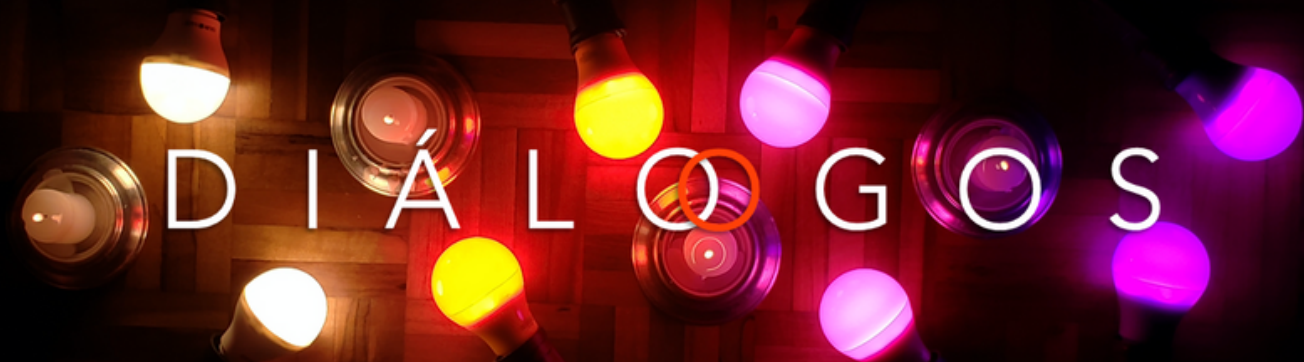
UMA PEÇA DE BRUNO NARCHI