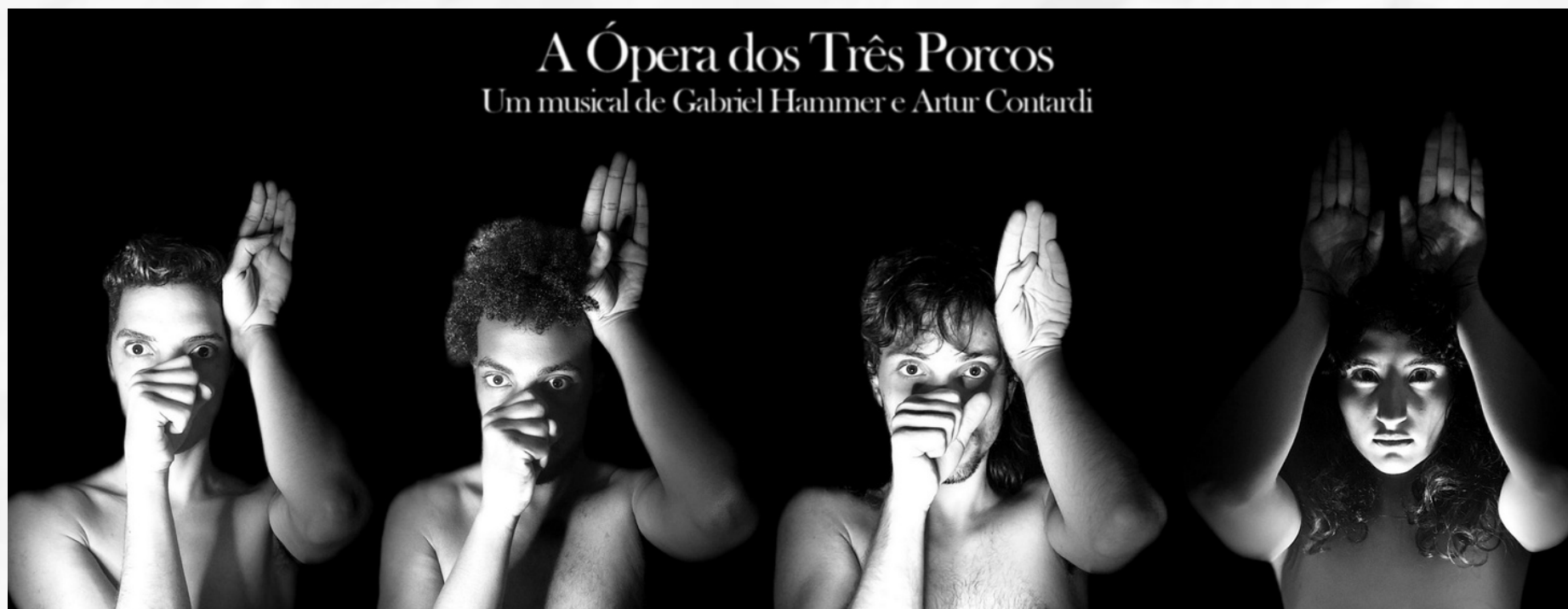
A Ópera dos Três Porcos Um musical de Gabriel Hammer e Artur Contardi